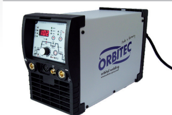
Inverter Tetrix 200