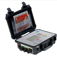
Steuerung Tigtronic Basic 3