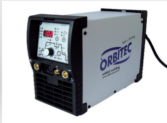
Inverter Tetrix 200