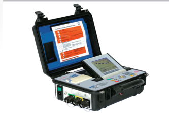
Steuerung Tigtronic Orbital 4