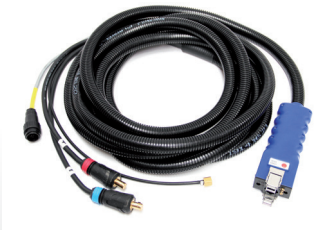
Antriebseinheit OSK C, 8m