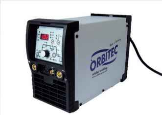
Inverter Tetrax 200