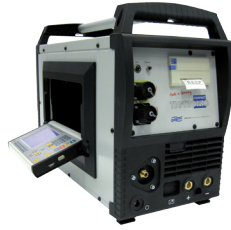
Steuerung Tigtronic Compact (A)