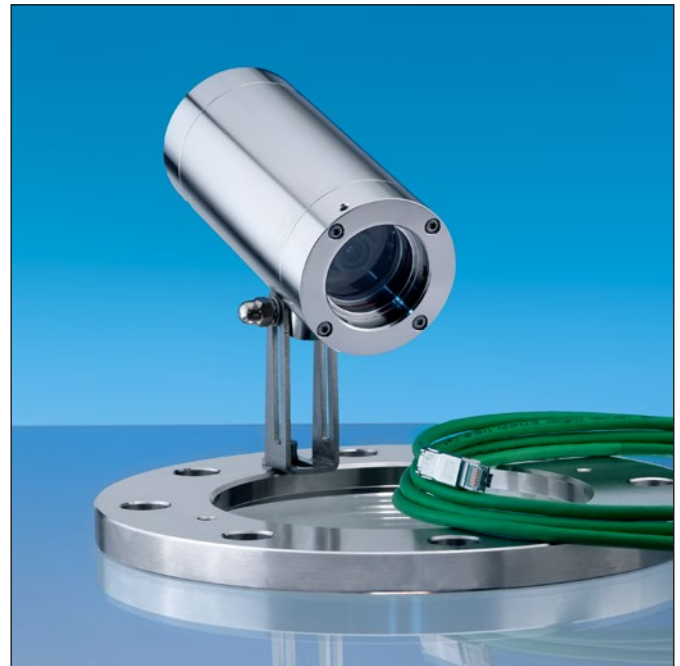
VISULEX Kamera K55-HD-Ex mit Klappscharnier auf einem Flansch montiert